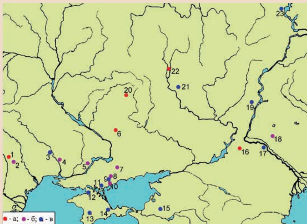
Рис. 10. Памятники кочевников VI — VII вв.: а — памятники типа Лихачевки (конец V — 1-я пол. VI в.); б — памятники типа Суханово (2-я половина VI — 1-я треть VII в.); в — погребения горизонта Сивашовки с ориентировкой на север (2 — 3-я трети VII в.): 1 — Старая Сарата; 2 — Селиште; 3 — Дмитровка; 4 — Новая Одесса; 5 — Суханово; 6 — Ново-Подкряж; 7 — Большой Токмак; 8 — Малая Терновка; 9 — Родионовка; 10 — Шелюги; 11 — Сивашское; 12 — Рисовое; 13 — Вилино; 14 — Новопокровка; 15 — Старонижестеблевская; 16 — Абганерово; 17 — Старица; 18 — Царев; 19 — Авиловский; 20 — Лихачевка; 21 — Таганский; 22 — Животино; 23 — Новоселки (Карта из публикации А. В. Комара)

Следует признать, что появление кочевников в лесостепной зоне (без их последующего перехода к оседлости) носило эпизодический характер. При этом их взаимоотношения с местным оседлым населением проявлялись по-разному.