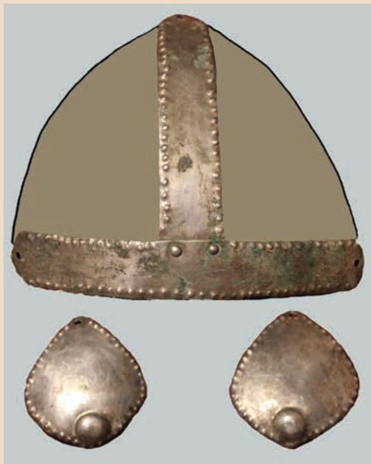
Рис. 3. Парсаты. Контурный рисунок шлема и наушники

Первый комплекс находок обнаружен в обнажении на склоне оврага, поблизости с разрушенным костяком крупных размеров. На лобной части черепа погребенного находилась Т-образная накладка, по бокам от которой располагались две пластины овальных очертаний (рис. 3). Из земли торчал меч (рис. 4), благодаря которому