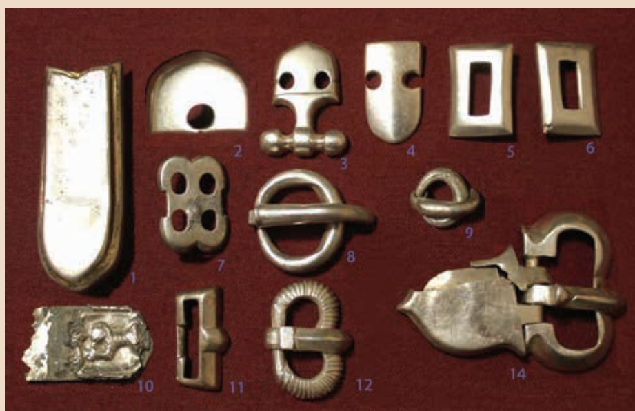
Рис. 5. Парсаты. Ременная геральдическая гарнитура. Комплекс 1

Ближайшие аналогии Т-образной накладки имеются среди предметов, переданных в Шиловский музей в 1991 г. А. И. Кочетковым, которые были найдены в болотистой низине у южного подножья Тереховского городища, слева от спускающейся с городища тропинки к озеру Чудино. Помимо Т-образной пластины, украшенной по краю тремя рядами мелких тисненых «жемчужин», здесь находились две прямоугольные пластины с приостренным выступом на одной из длинной сторон и прямоугольным выступом — на второй, украшенные по периметру такими же рядами «жемчужин» (рис. 6). Парные элементы обоих описанных комплексов, по-видимому, являются деталями наушников шлема, а Т-образные клепаные пластины напоминают арматуру шлемов типа шпангельхельм (Spangenhelm), бытующих в рязано-окских древностях с VI в. Их остатки найдены поблизости от Тереховского городища на могильнике