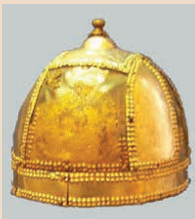
Рис. 7. Сасанидский шлем из Северного Ирана