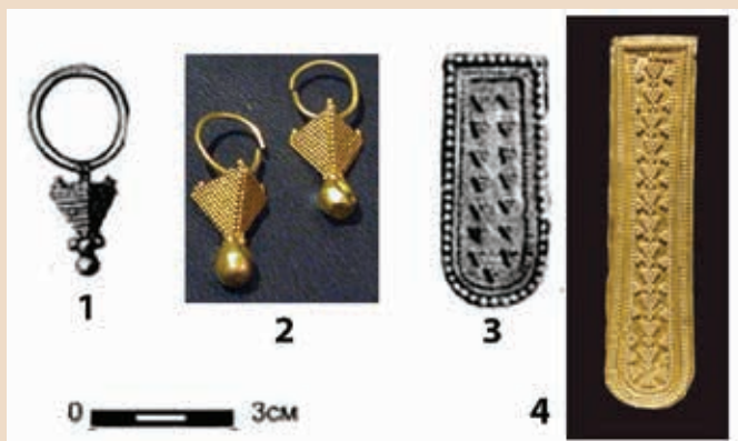
Рис. 2. Золотые предметы из Арцыбашево (1, 3) и их аналоги из Венгерского национального музея (2, 4)

Данный тезис получил дальнейшее развитие в работе И. Р. Ахмедова 3 . В ходе исследования небольшой площади на Тереховском городище, расположенном в Шиловском районе Рязанской области, им были выявлены следы гибели городища в результате набега кочевников, исходной территорией которого могло быть место расположения Арцыбашевского погребения. Поскольку данное городище являлось административным и торгово-ремесленным центром окских финнов, то его гибель положила начало распаду единства рязано-окской культуры, большая часть населения которой покинула территории правобережного бассейна р. Оки. Однако единичность Арцыбашевского погребения вызывала определенный скепсис у ряда археологов по поводу достоверности описанного сценария событий. В частности, подобные сомнения были высказа-