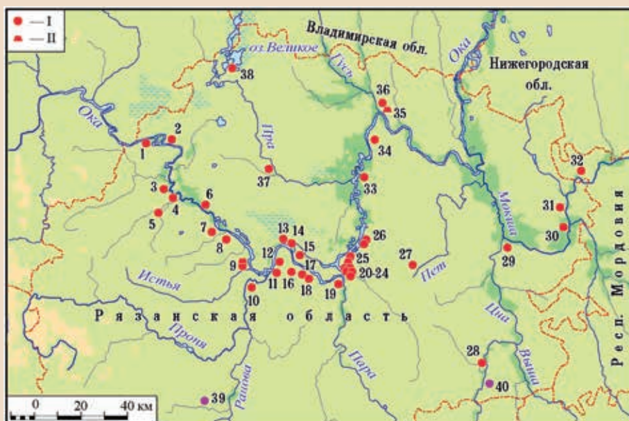
Рис. 1. Памятники рязано-окских финнов и погребения кочевников: I — могильники; II — поселения. 1 — Вакинский; 2 — Кузьминский; 3 — Фелеловский; 4 — Борковской; 5 — Дашковский; 6 — Дубровичский; 7 — Кораблинский; 8 — Гавердовский; 9 — Троице-Пеленицы; 10 — Заречье 4; 11 — Никитинский; 12 — Шатрищенский; 13 — Киструский; 14 — Дегтяное; 15 — Облачинский; 16 — Еремеевский; 17 — Дуброво-Срезневский; 18 — Бортниковский; 19 — Шиловский; 20 — Кулаковский; 21 — Пролетарский; 22 — Белье Бугры; 23 — Борок 2; 24 — Ундрих; 25 — Терехово; 26 — Тьрноковский; 27 — Мелеховский; 28 — Польное-Ялтуново; 29 — Кошибеевский; 30 — Старокадомский; 31 — Кокуй; 32 — Шокшинский; 33 — Куземкинский; 34 — Курманский; 35 — Земляной Струг; 36 — Царицынский; 37 — Деулинский; 38 — Барское 2 — Шагара 5; 39 — Арцыбашево; 40 — Парсаты. (Карта из публикации И. Р. Ахмедова и А. П. Гаврилова с дополнениями)

керамику к посуде салтово-маяцкой культуры, а также выдвинул предположение, что погребение принадлежало кочевникам, обитавшим в бассейне р. Дон. Бли-