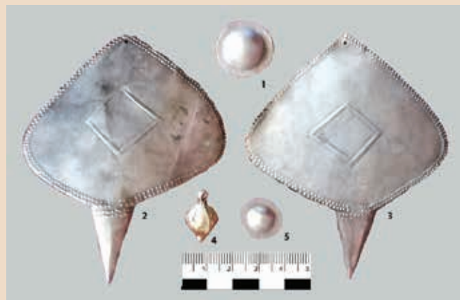
Рис. 9. Парсаты. Накладки на шлем

Здесь же находились две умбовидные нашивки с петлями с внутренней части — одна покрупнее, другая помельче (рис. 9, 1, 5).