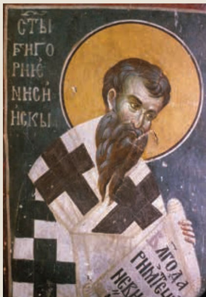
Святитель Григорий. Епископ Нисский. Фреска церкви Святых Иоакима и Анны в Студенице. Сербия, 1314 г.