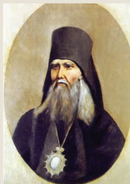
Святитель Феофан Затворник. Автопортрет.