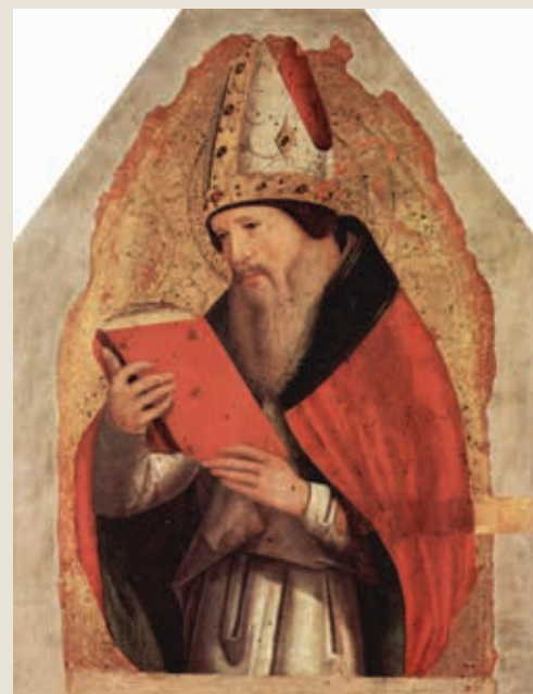
Антонелло да Мессина. Святой Августин. 1472 — 1473 гг.

ности в трактовке рассматриваемых феноменов представляется затруднительным. Тем не менее, на наш взгляд, можно обозначить определенные векторы, прослеживающиеся в святоотеческих учениях.