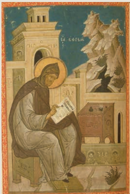
Преподобный Ефрем Сирийский. Книжная миниатюра. XV в. Российская государственная библиотека

Ефрем Сирийский писал об обманчивости образов ночных видений, сравнивая их с ложными ценностями мира реального: «Как сон обманывает своими обещаниями, так и мир обманывает своими удовольствиями и благами» 7 . Августин Блаженный