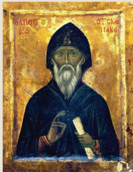
Преподобный Иоанн Лествичник. Икона. Византия.

Блаженный Диадок Фотикийский писал: «Сны, являющиеся по любви Божией, не изменяются из одного образа в другой, не наводят страха, не возбуждают смеха или внезапной печали, но приступают к душе со всею тихостью и напол-