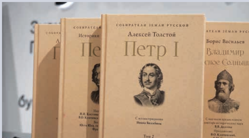
В год 350-летия Петра I РВИО приступило к изданию книжной серии «Собиратели земли русской»