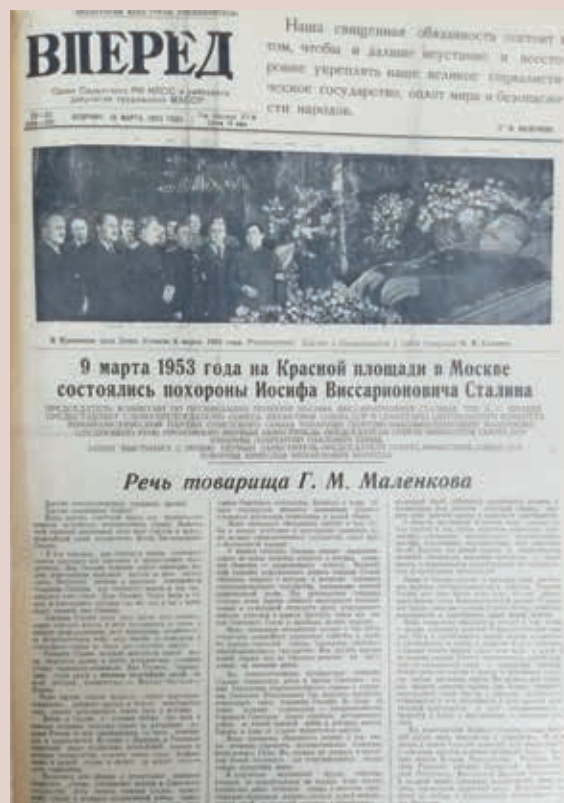
Речь Г. М. Маленкова в газете «Вперед» (Саранский район). 1953 г. 10 марта

The speech of G. M. Malenkov in the newspaper "Forward" (Saransky district). March 10, 1953