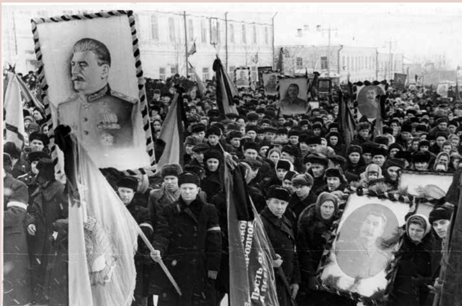
Саранск, ул. Советская. Март. 1953 г.