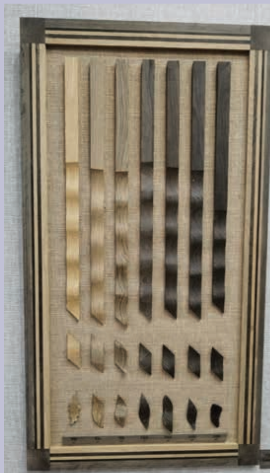
Радуга мореного дуба. Образцы субфоссильной древесины разного возраста, представленные на выставке «Черный алмаз Мордовии». 2022 г. МРМВИ им. С. Д. Эрзы

A sample of subfossilized oak wood. Mordovian Republican United Museum of Local Lore named after I. D. Voronin. No. KP 1380