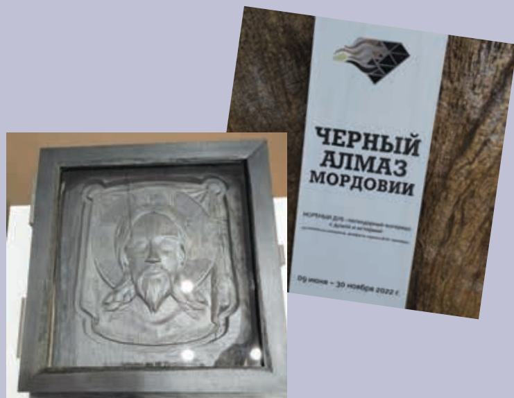
Икона «Спас Нерукотворный». Мореный дуб. Фото с выставки «Черный алмаз Мордовии». 2022 г. МРМИИ им. С. Д. Эрззи

С одной стороны, в 1990-е гг. некоторые предприниматели попытались организовать в Мордовии бизнес по добыче мореного дуба. Однако они не имели должных знаний и высокопрофессиональных специалистов в данной отрасли, не привлекали значительных капиталовложений. Результатом этой, в сущности, хищнической практики стала безвозвратная утеря многих кубических метров ценнейшего мате-