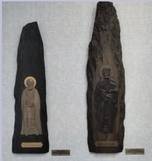
Иконы «Сергий Радонежский» и «Николай Чудотворец» на доске. Мореный дуб. Фото с выставки «Черный алмаз Мордовии». 2022 г. МРМИИ им. С. Д. Эрззи

The Icon "The Saviour Not Made by Hands". Bog oak. Photo from the exhibition "Black Diamond of Mordovia". 2022. Mordovian Erzia Museum of Visual Arts