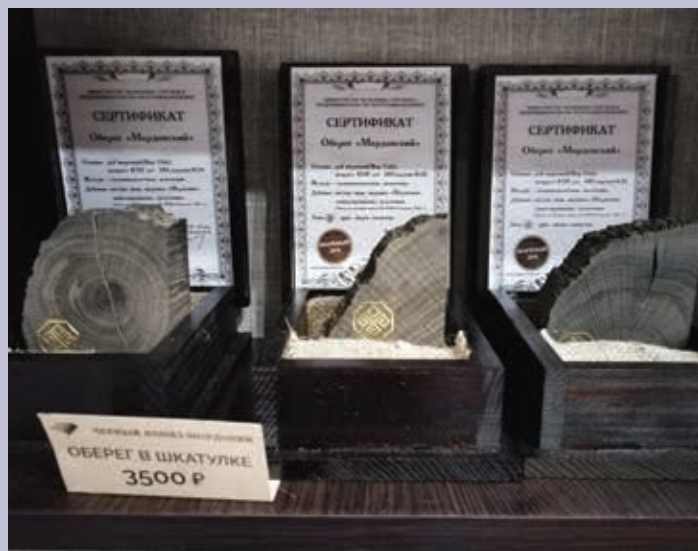
Обереги в шкатулках. Мореный дуб. Фото с выставки «Черный алмаз Мордовии». 2022 г. МРМИИ им. С. Д. Эрзы

Amulets in caskets. Bog oak. Photo from the exhibition “Black Diamond of Mordovia”. 2022. Mordovian Erzia Museum of Visual Arts