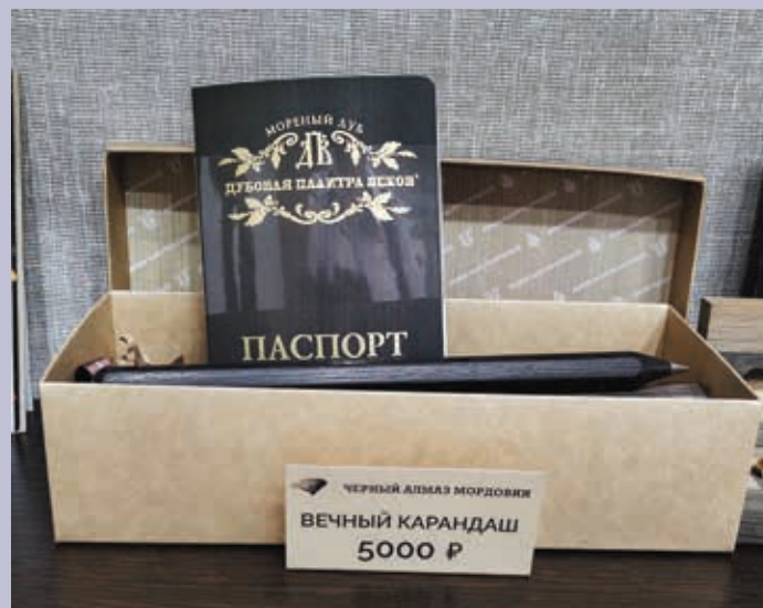
Вечный карандаш. Мореный дуб.