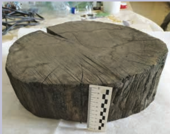
Образец субфоссильной древесины дуба. МРОКМ им. И. Д. Воронина. КП 1380

История мореного дуба в России представляет собой чередование трудностей и ошибок, сопряженных с особой сложностью его практической добычи, хранения и обработки [6]. Процесс целенаправленной кустарной добычи древесины дуба со дна рек начался еще в XVIII столетии при Петре I в основном для поставки королевским дворам в Европу, затем был