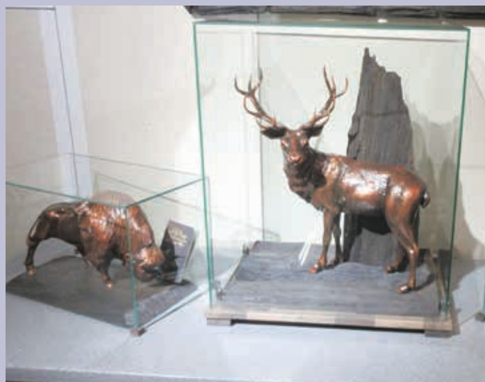
Скульптуры животных. Мореный дуб. Из экспозиции в отеле «Radisson Hotel & Congress Center Saransk». г. Саранск Sculptures of animals. Bog oak. From the exposition at the Radisson Hotel & Congress Center Saransk

1940-х гг. — фонды Саранской конторы мореного дуба, хранящиеся в Центральном государственном архиве Республики Мордовия (ЦГА РМ) и текущем архиве отдела истории НИИ гуманитарных наук при Правительстве Республики Мордовия. Из них можно почерпнуть бесценные сведения, включающие составленные в те годы карты залегания сырья на дне Мокши и Суры. Значительный практический интерес могут представлять также описания особенностей технологического процесса подъема дуба на поверхность и его первичной обработки, которые зафиксированы в отчетах и протоколах технических совещаний при конторе, которые часто проводились на местах добычи (города Краснослободск, Темников) или передавались в Казань, в расположенный там Волжско-Камский филиал ЦНИИ Лесосплава Министерства лесной промышленности СССР. Другими источниками являются многочисленные статьи специалистов по данной проблематике и увлекающихся темой мореного дуба, регулярно появляющиеся как в специализированной («ЛесПромИнформ», «Лесной Эксперт», «Лесной вестник», «Лесотехнический журнал», «Лидер»), так и в массовой («Красная Мордовия», «Известия Мордовии») прессе (имеются и ранние статьи советского периода) 9 . Особый интерес посетителей музея, безусловно, вызовут исследования, посвященные применению мореного дуба в широко известных памятниках культурного и военно-исторического наследия. Очевидно, что такие реминесценции