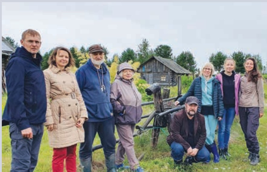
Участники экспедиции в Северную Карелию. Деревня Хайколя. 2023 г. Participants of the expedition to North Karelia. Haikolya village. 2023

Важное место в секторе этнологии занимают полевые исследования. Безусловную ценность представляют публикации сборников полевых материалов студентов-этнографов Ленинградского университета в 1930 г.,