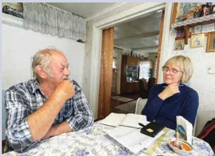
Член-корреспондент РАН И. И. Муллонен записывает топонимический материал. Экспедиция на Поморский берег Белого моря, с. Сумский Посад. Август 2023 г.

Corresponding Member of the RAS I. I. Mullonen records toponymic material. Expedition to the Pomorsky coast of the White Sea, Sumsky Posad Village. August 2023