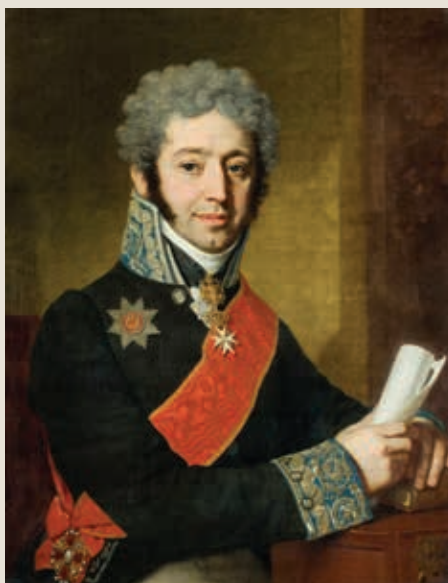
В. Л. Боровиковский. Портрет князя А. А. Долгорукова. 1811 г. Государственная Третьяковская галерея

Ф. Баджи писал о русском поручике Маслове, который сопровождал их в Симбирскую губернию, что тот постоянно присваивал деньги, выделенные на питание и транспортировку пленных, и неуклюже пытался оправдаться перед офицерами. По прибытии в