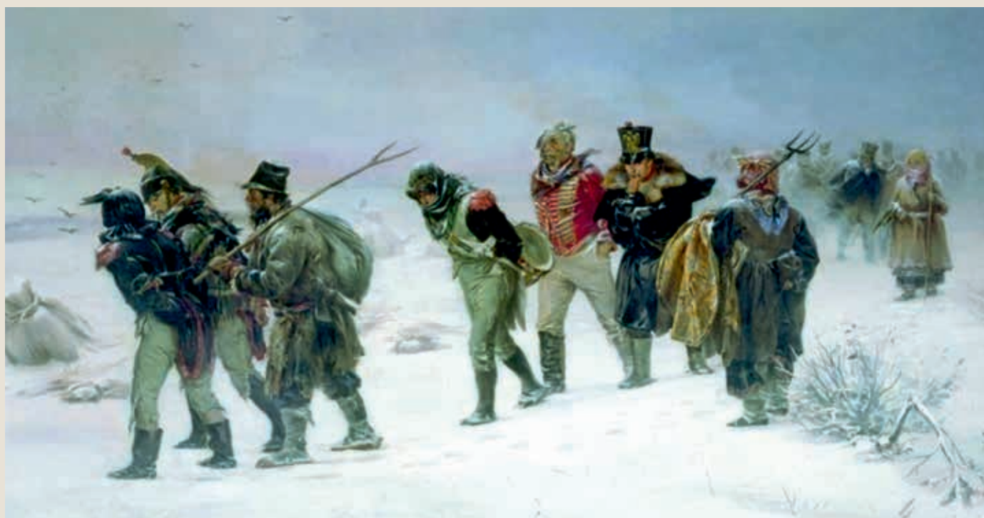
И. М. Прянишников. В 1812 году. 1874 г. (URL: https://commons.wikimedia.org )

глашению офицеров к ним перешел жить итальянский сержант, который занимался домашними делами... Купили необходимые предметы: закрывающееся деревянное ведро для кваса, жестяные и стеклянные стаканы, железные горшки и сковороды, напольный таз, железные и деревянные ложки, деревянные тарелки и миски. Люди, у которых проживали итальянские офицеры, готовили им пищу и охотно оказывали другие услуги. Крестьянин, живший в со-