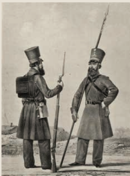
Воины пеших полков Пензенского ополчения. 1812 — 1813 гг. (Висковатов А. В. Историческое описание одежды и вооружения российских войск : в 30 т. СПб., 1860. Т. 18)

В конце сентября Наполеон сосредоточил главные силы у г. Лейпцига, где предполагал дать генеральное сражение. В этих условиях Л. Л. Беннигсен получил предписание «оставить нужное число войск для наблюдения за неприятелем у Дрездена, а с прочими идти к Лейпцигу», чтобы содействовать «в общей на неприятеля атаке» 9 . Поволжское ополчение, в том числе Пензенское, численностью около 12 тыс. чел. (кроме конного полка Пензенского ополчения, который находился в авангарде Польской армии и был направлен под Лейпциг), и 6-тысячный отряд генерал-лейтенанта Е. И. Маркова под общим командованием графа П. А. Толстого были оставлены