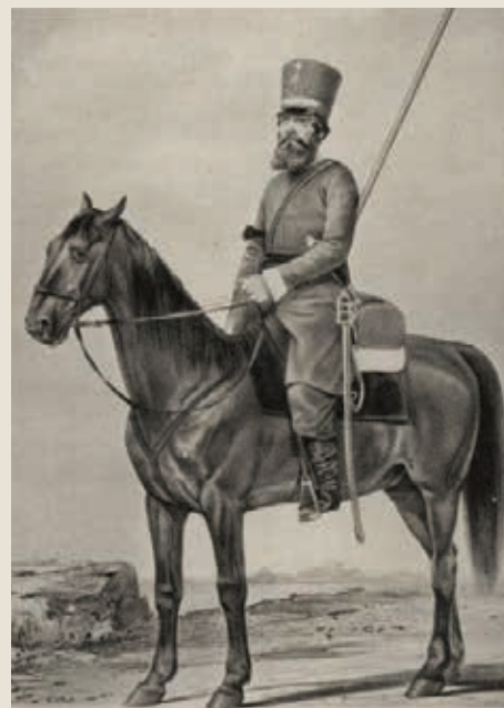
Воин конного полка Пензенского ополчения. 1812 — 1813 гг. (Висковатов А. В. Историческое описание одежды и вооружения российских войск : в 30 т. СПб., 1860. Т. 18)

Обстановка, сложившаяся под Дрезденом, вызывала серьезные опасения графа П. А. Толстого. 4 октября он сообщал в Главный штаб действующей армии: «Число войск неприятельских, находящихся под Дрезденом под коман-