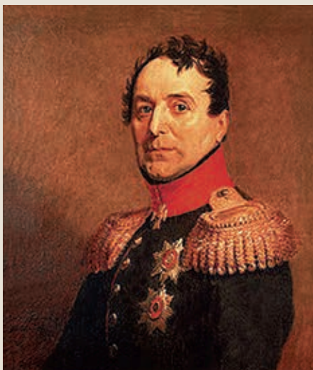
Дж. Доу. Портрет графа П. А. Толстого. 1820 г.

На рассвете 5 октября маршал Г. Сен-Сир атаковал позиции корпуса П. А. Толстого. Скрытно выстроившись у городских стен, французы численностью до 20 тыс. чел. четырьмя колоннами «выступили из Дрездена и со всех сторон атаковали наши отряды» 15 . Первый удар на левом фланге приняли на себя полки Пензенского ополчения. Прапорщик П. И. Юматов позднее вспоминал: «4-го октября, в ночь на 5-е, я наряжен был в караул на форпост, в королевский сад, где был большой каменный дом, окру-