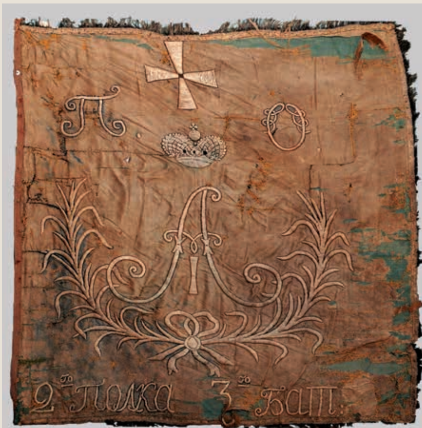
Знамя 3-го батальона 2-го пехотного полка Пензенского ополчения. Пензенский государственный краеведческий музей