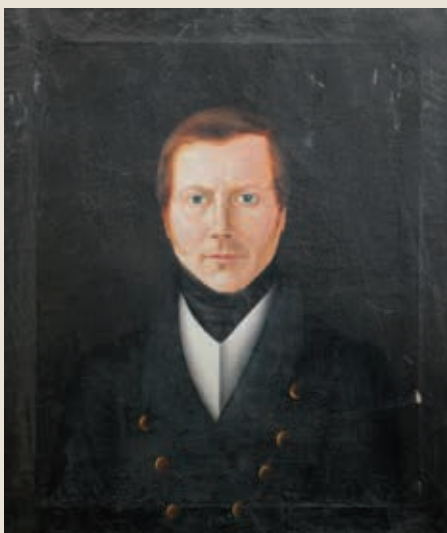
Портрет И. В. Сабурова. 1820-е гг. Пензенский государственный краеведческий музей

Основная причина отхода корпуса графа П. А. Толстого из-под Дрездена 5 октября заключается