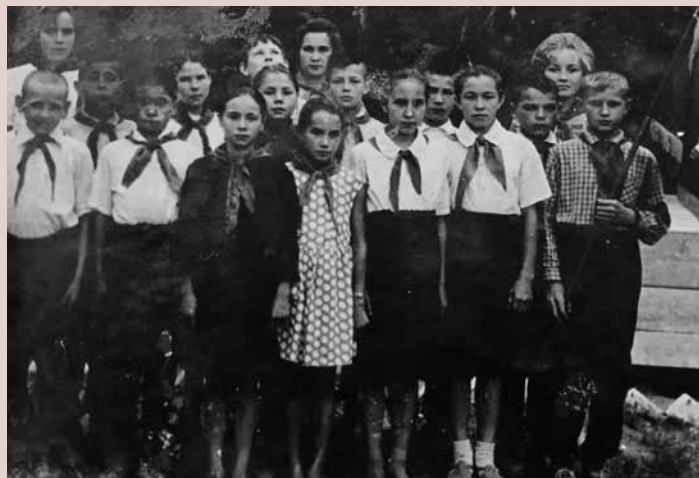
Школьный пионерский лагерь. с. Аксаитово Татышлинского района Башкирской АССР. 1965 г.