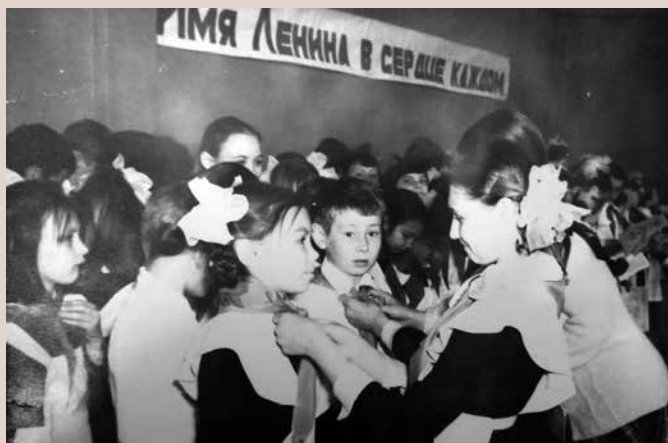
Посвящение в пионеры. Школа № 13 г. Нижнекамска, 1986 г.