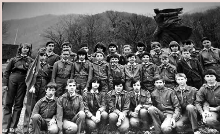
Пионерский лагерь «Орленок». 1986 г.