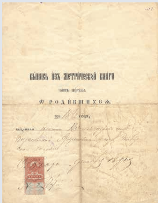
Выпись из метрической книги о рождении Г. С. Баранова. 1892 г. МРОКМ и.м. И. Д. Воронина. КП 2860/8