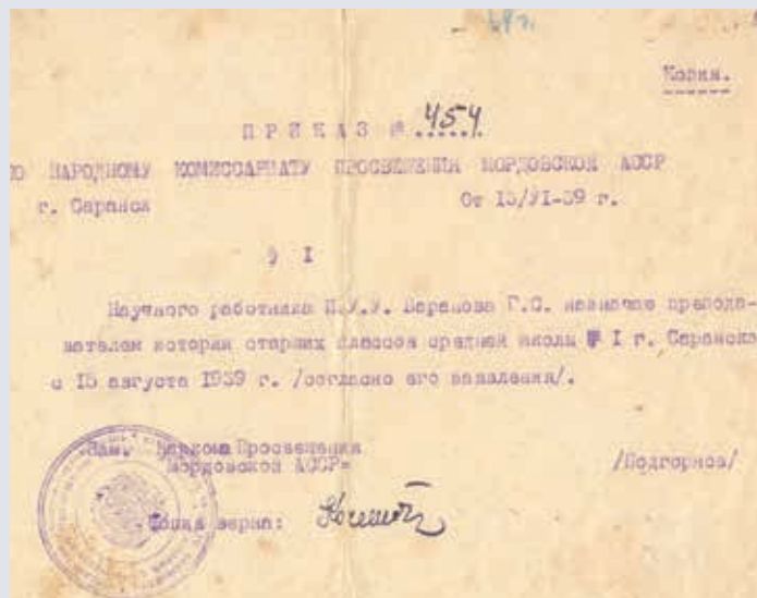
Копия приказа № 454 по Народному комиссариату просвещения МАССР. 1939 г. МРОКМ им. И. Д. Воронина. КП 2860/15