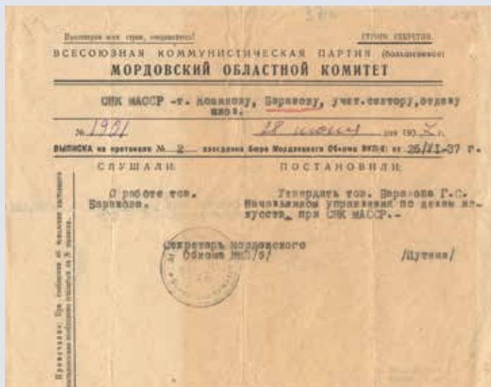
Выписка из протокола № 2 заседания бюро Мордовского обкома ВКП(б). 1937 г. МРОКМ им. И. Д. Воронина. КП 2860/17