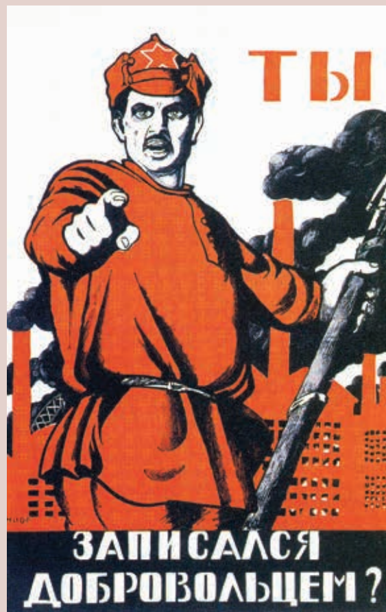
Д. Мур. Плакат «Ты записался добровольцем?». 1920 г. D. Moor. The poster "Did you enroll as a volunteer?". 1920

Военкомы занимались и делами особой важности: противодействие контрреволюционным силам, организация медицинских комиссий, следили за психи-