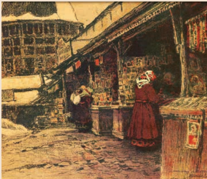
В. И. Соколов. Иконные лавки. Из альбома «Сергиев Посад» (1916 — 1917 гг.)

V. I. Sokolov. Icon shops. From the album "Sergiev Posad" (1916 — 1917)