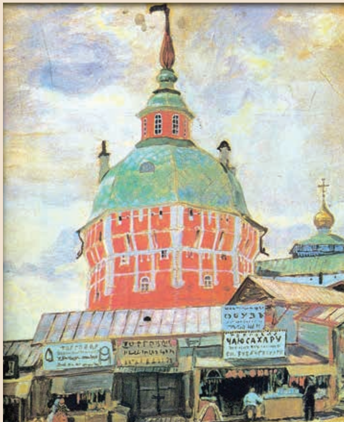
Б. М. Кустодиев. Красная башня Троице-Сергиевой лавры. Торговые лавки. 1912 г.

В рецензируемом сборнике имеются введение, в котором сделан источниковедческий анализ и дана археографическая характеристика документов, и развернутые комментарии — добротное самостоя-