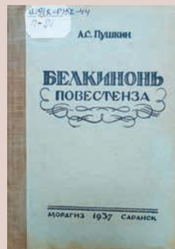
Обложка издания «Повести Белкина» на мокшанском языке. Саранск. 1937 г.