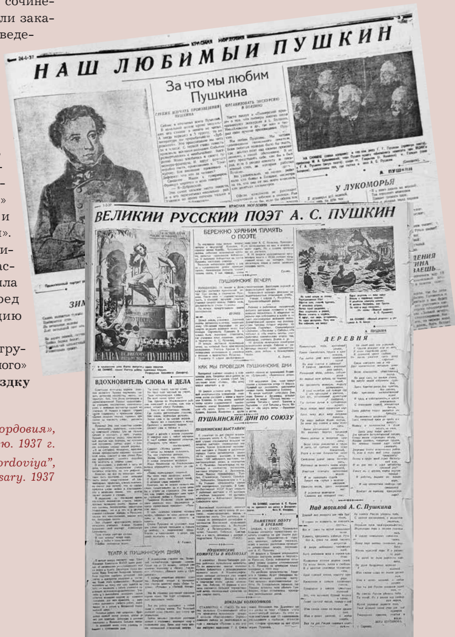
Тематические разделы газеты «Красная Мордовия», посвященные юбилею. 1937 г.

Во время проведения юбилейных мероприятий большую роль сыграли культурно-просветительные учреждения и средства массовой информации, в том