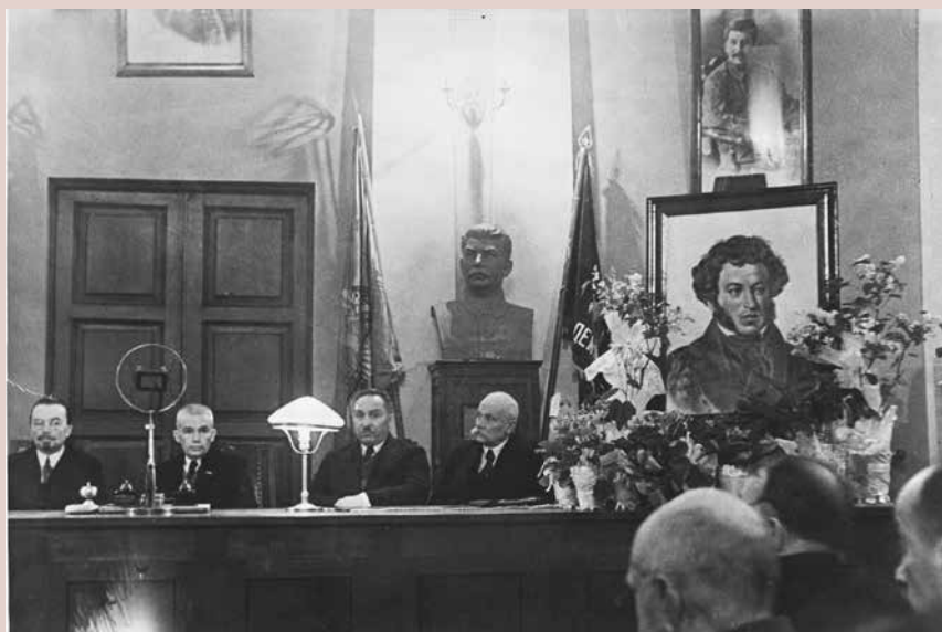
Торжественное заседание, посвященное памяти А. С. Пушкина. Москва. 1937 г.

A meeting of celebration, dedicated to the memory of A. S. Pushkin. Moscow. 1937.