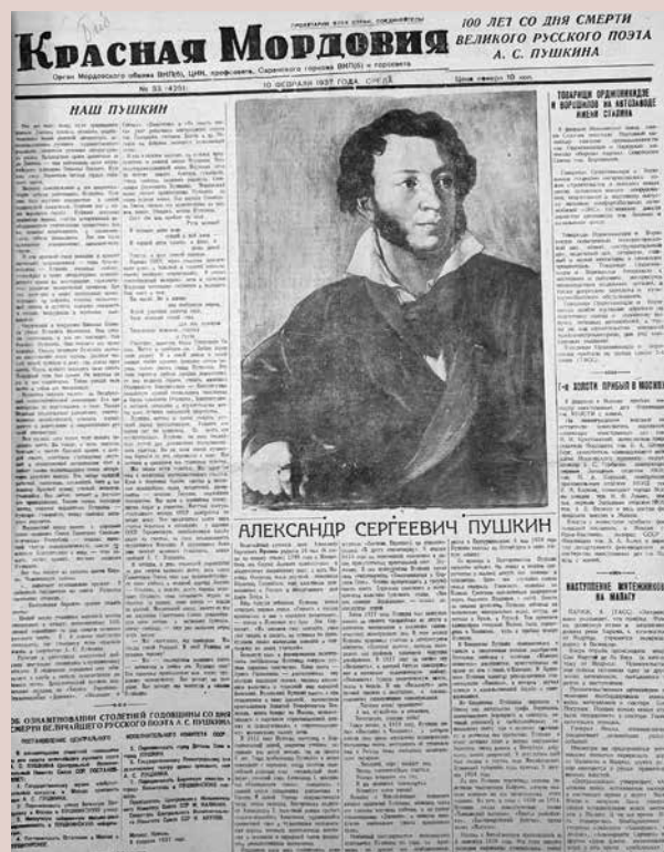
Первая страница юбилейного номера газеты «Красная Мордовия». 10 февраля 1937 г.

Значительную роль в проведении юбилея сыграли библиотеки. Только за ноябрь — декабрь 1936 г. Детская библиотека Саранска приобрела 150 книг А. С. Пушкина, среди которых были «Повести покойного Ивана Петровича Белкина», «Капитанская дочка», «Дубровский», сказки и поэмы 102 . По некоторым сведениям, только в Саранске во время пушкинских дней, т. е. с лета 1936 г. по весну 1937 г., с произведениями писателя познакомились 5 210 чел. 103 Между тем удовлетворить большой интерес к книгам А. С. Пушкина, особенно в районах, было довольно сложно. Например, Старошайговская библиотека вынуждена была направлять в колхозы передвижки с литературой 104 . Вот что писал об обстановке в Ардатове корреспондент «Крас-