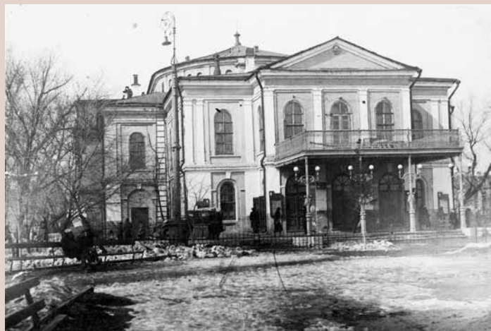
Театр оперы и балета им. Н. Г. Чернышевского до реконструкции. Архитекторы: А. М. Салько, К. В. Тиден. 1864 г. Фото 1938 г.

The Opera and Ballet Theatre named after N. G. Chernyshevsky before reconstruction. Architects A. M. Salko, K. V. Tiden. 1864. Photo of 1938