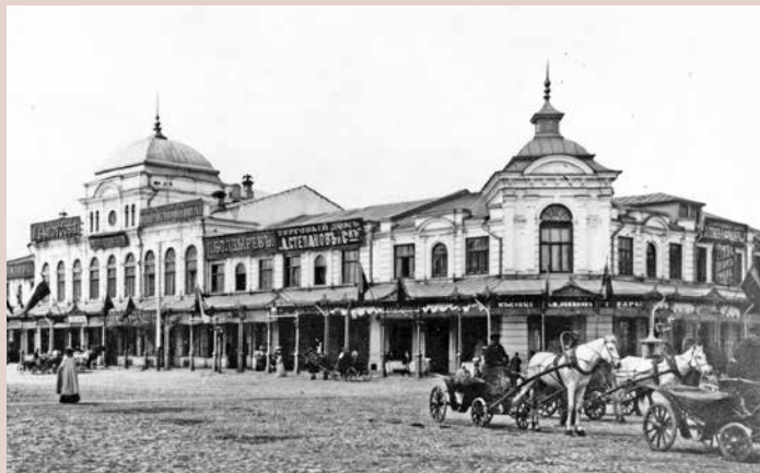
Новый Гостиный двор после реконструкции 1895 г. Архитектор — С. И. Тихомиров. Фото 1902 г. New Gostiny Dvor after reconstruction in 1895. Architect S. I. Tikhomirov. Photo of 1902

Приход к власти большевиков в октябре 1917 г. знаменовал собой начало коренных изменений пространства городов. Этот процесс включал в себя, с одной стороны, масштабную кампанию по уничтожению изваяний императоров и других государственных деятелей Российской империи 1 , с другой — маркировку городской территории новыми символами (в соответствии с ленинским планом «монументальной пропаганды»). С началом форсированной социалистической модернизации поле изменений городского пространства стало включать и застройку городов, в том числе их центральных частей. Во второй половине XX в. трансформации облика и социального пространства центральных площадей советских городов резко активизировались.