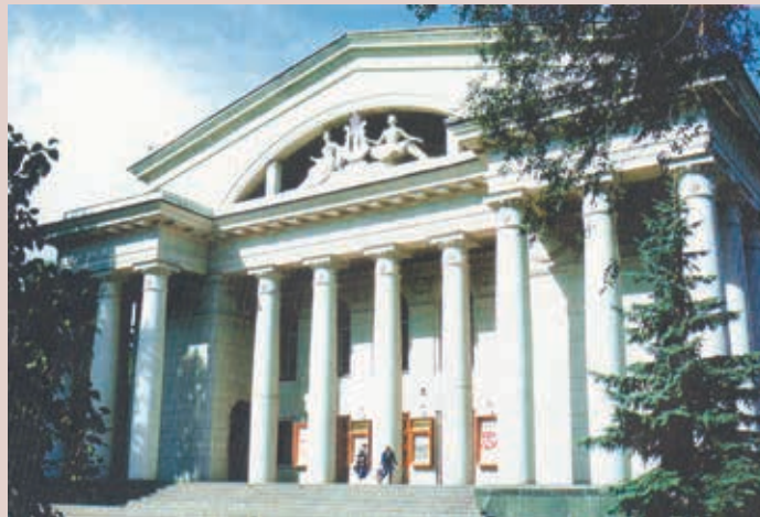
Театр оперы и балета им. Н. Г. Чернышевского после реконструкции 1957 — 1960 гг. (архитекторы: Т. Г. Ботьяновский, Л. И. Ячин, О. А. Гера) с установленной в 1967 г. скульптурной группой (скульптор — В. И. Перфилов). Фото 1994 г.

The Opera and Ballet Theatre named after N. G. Chernyshevsky before reconstruction. Architects A. M. Salko, K. V. Tiden. 1864. Photo of 1938