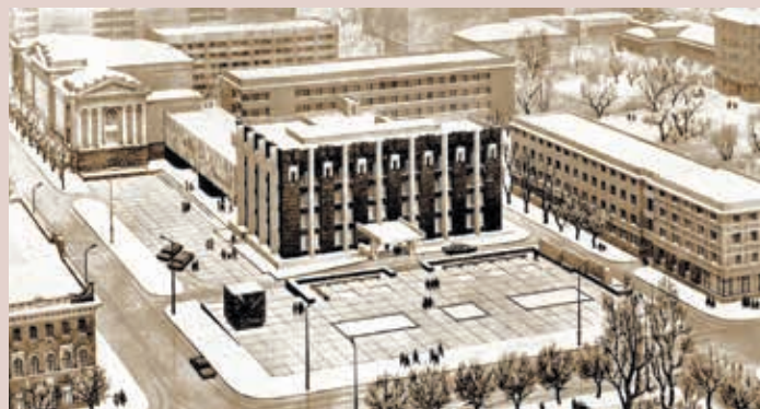
Проект здания Саратовского горкома КПСС (архитекторы: О. А. Гера, В. Н. Чураков, В. В. Цой, И. В. Кротков, В. Н. Фукс, Б. Н. Донецкий; 1976 — 1978) The project of the building of the Saratov City Committee of the CPSU (architects O. A. Ger, V. N. Churakov, V. V. Tsoi, I. V. Krotkov, V. N. Fuks, B. N. Donetsk, 1976 — 1978)