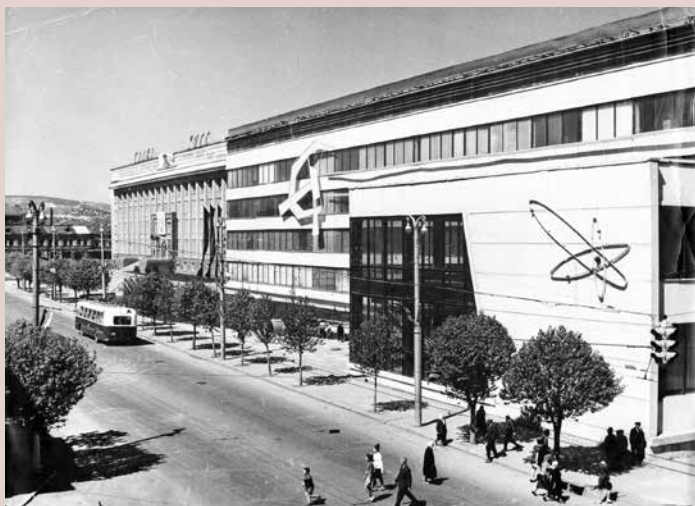
Здание Центрального НИИ измерительной аппаратуры (архитектор неизвестен, середина 1960-х гг.). Фото 1967 г.

The building of the Central Research Institute of Measuring Equipment (architect is unknown, the middle of the 1960s). Photo of 1967