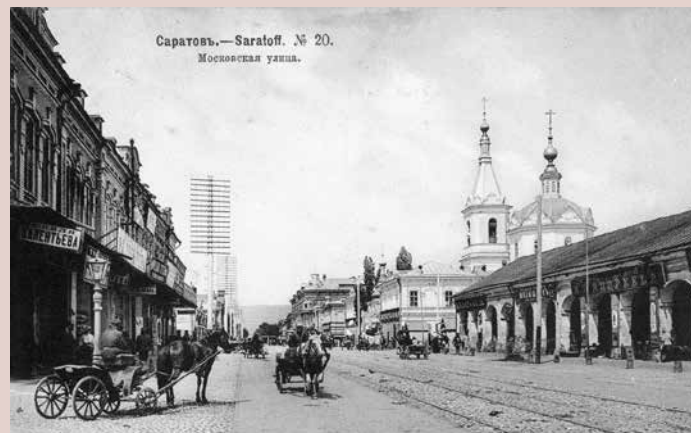
Здания Верхнего базара (архитектор — А. М. Салько, 1876 — 1908) и Петропавловской (Сретенской) церкви (архитектор неизвестен, 1818). Открытка 1905 г. The buildings of the Upper Bazaar (architect A. M. Salko, 1876 — 1908) and the Peter and Paul (Sretenskaya) Church (architect is unknown, 1818). Postcard of 1905

Еще в 1808 г. при расширении городской территории на этом месте была основана торговая площадь