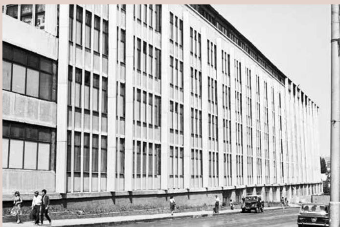
Здание Центрального НИИ измерительной аппаратуры после реконструкции 1979 г. Фото 1981 г. The building of the Central Research Institute of Measuring Equipment after reconstruction in 1979. Photo of 1981

рошенко критиковал подобное решение, так как оно абсолютно не гармонировало с архитектурой зданий ВНИИГГ и предлагал металлические пилоны в части здания, обращенной на площадь Революции, заменить на железобетонные, аналогичные пилонам здания облсполкома 28 . Тем не менее, к зданию были пристроены именно металлические пилоны, что сделало его облик, и так контрастный по отношению к окружающей застройке, диссонирующим.