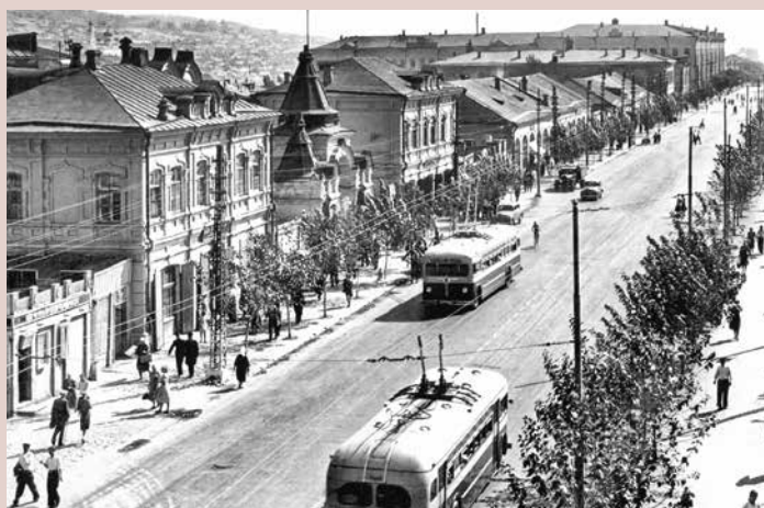
Здания Верхнего базара, сохранившиеся к 1950-м гг. Фото 1953 — 1958 гг.

Необходимо отметить, что было разработано около десяти проектов реконструкции (в том числе точечных) центральной площади Саратова. В начале изучаемого нами периода в общественном дискурсе города возникла идея разместить на территории указанной площади новый памятник борцам революции 1917 г.,