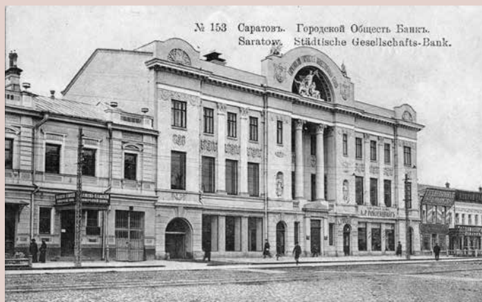
Здание Городского общественного банка. Архитектор — П. М. Зыбин. 1911 — 1913. Открытка 1914 г.

The building of the City Public Bank. Architect P. M. Zybin. 1911 — 1913. Postcard of 1914