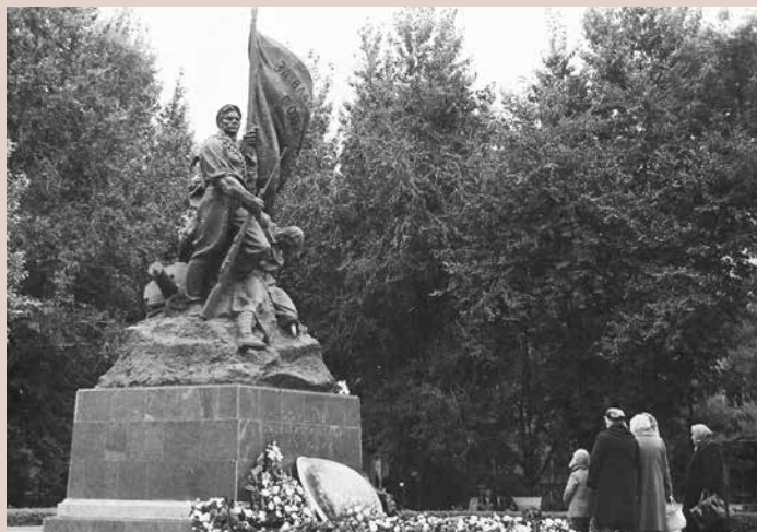
Памятник борцам революции 1917 г. Скульптор — В. И. Перфилов. 1957. 1968 г.

для чего в 1949 г. Саратовской организацией Союза советских архитекторов был проведен конкурс на лучший проект этого монумента. Победу в нем одержал проект архитектора Ю. В. Василянского, эскизы которого легли в основу архитектурной части памятника, выполненного в 1957 г. саратовским скульптором В. И. Перфиловым 9 . Именно этот бетонный монумент был установлен в сквере в 40-ю годовщину Октябрьской революции. Памятник выполнен в форме фигур красноармейца-победителя, пулеметчика с гранатой и сраженного пулей знаменосца, держащего в руке флаг с начертанными на нем словами: «За власть Советов!». Надпись на постаменте, разработанном архитектором В. М. Дегтяревым, гласила: «Борцам социалистической революции 1917 года». У подножия памятника уложена гранитная плита с именами похороненных в братской могиле солдат. 6 ноября 1967 г. в рамках торжеств,