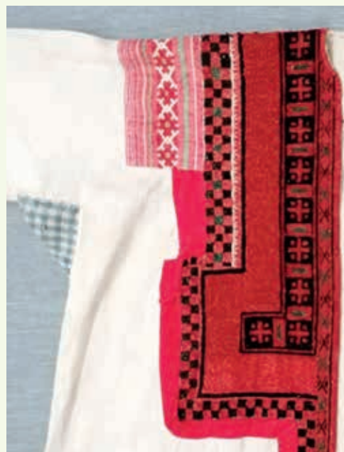
Крест в фрагменте вышивки оплечья и груди женской распахнутой праздничной ружи мордвы-эрзы с. Шугурова Ардатовского уезда Симбирской губернии (ныне Большеберезниковского района Республики Мордовия). Начало XX в. МРОКМ им. И. Д. Воронина

села, совершаемый мордвой в случае опасности возникновения эпидемии, сопровождался схематическим нанесением креста в месте соединения «защитного круга», создаваемого по внешней границе населенного пункта. Широко представлен орнамент в виде креста и в вышивке мордовской одежды. В обрядовой практике нанесение креста во время заговоров от болезни считалось способом предотвратить ее распространение или избавиться от нежелательных проявлений. Такие параллели, просматривающиеся даже при поверхностном обращении к смысловой наполненности зна-