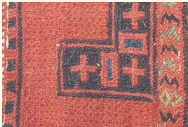
Крест в фрагменте вышивки оплечья и груди распахнутой женской одежды ружья. Начало XX в. Дубенский район Республики Мордовия. МРМИИ им. С. Д. Эрзы

A cross in a fragment of embroidery on the shoulder and chest of a women's swing festive rutsya of the Mordovins-Erzya of the village of Shugurovo, the Ardatovsky District of the Simbirsk Governorate (now the Bolshebereznikovsky District of the Republic of Mordovia). The early XX century. Mordovian Republican United Museum of Local Lore named after I. D. Voronin