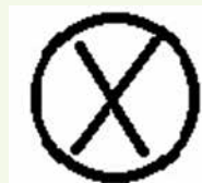
Знак семьи Бояркиных из с. Черненова

Однако между знаками семей Бояркиных из с. Сабанчево Атяшевского района и с. Шугурова Большеберезниковского района, расположенных в пределах Республики Мордовия, наблюдается некоторое сходство графической основы.