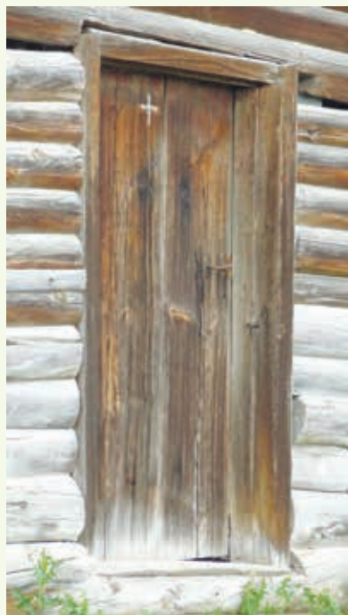
Крест на двери дома с. Поводимова Дубенского района Республики Мордовия. 2019 г. A cross on the door of the house in the village of Povodimovo, the Dubensky District of the Republic of Mordovia. 2019

Наиболее архаичный пласт представлений о тех или иных символах в этническом сознании просматривается в мифологическом нарративе той или иной сферы деятельности человека. Так, судя по материалам могильников, в металлообработке и керамике применялись простые знаки — символы, несшие в себе апотропейные свойства. Распространенными являлись крестовидные знаки на металлических украшениях и глиняных горшках. Существует мнение, что эти крестовидные знаки, которые воплощали в языческой религии очистительную силу, ограждали человека от бед и болезней 1 . Крестом как символом защиты от всего плохого защищали и до сих пор защищают пространство дома, особенно его пограничные места: окна, двери. Некогда существовавший обряд опахивания