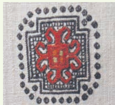
Кучка. Центральная звездочка, вышитая на свадебном покрывале мордвы-мокши Ковылкинского района Республики Мордовия. Фрагмент. XIX — XX вв. МРМИИ им. С. Д. Эрзи