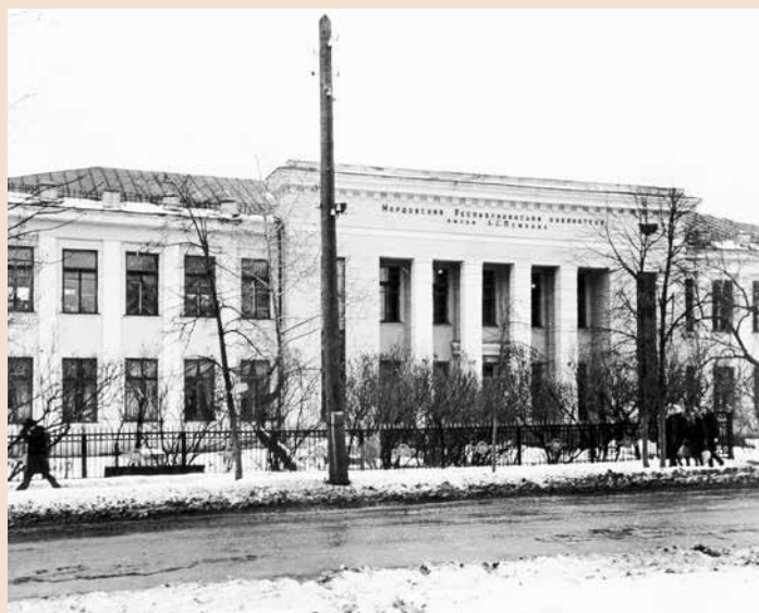
Здание Республиканской библиотеки им. А. С. Пушкина. 1960-е гг. The building of the Republican Library named after A. S. Pushkin. The 1960s

ственной войны она не переставала работать: в здании был организован пункт по приему посылок и вещей для Красной армии, библиотекари трудились на механическом заводе, в госпиталях, участвовали в транспортировке раненых, заготавливали дрова. В 1970 г. библиотека переехала в другое здание.