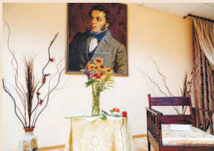
В Пушкинском зале Национальной библиотеки им. А. С. Пушкина Республики Мордовия

Национальная библиотека им. А. С. Пушкина Республики Мордовия — участник национального проекта «Культура» в части региональных проектов «Обеспечение качественно нового уровня развития инфраструктуры культуры» («Культурная среда»), «Создание условий для реализации творческого потенциала нации» («Творческие люди»), «Цифровизация услуг и формирование информационного пространства в сфере культуры» («Цифровая культура»), программы «Пушкинская карта».