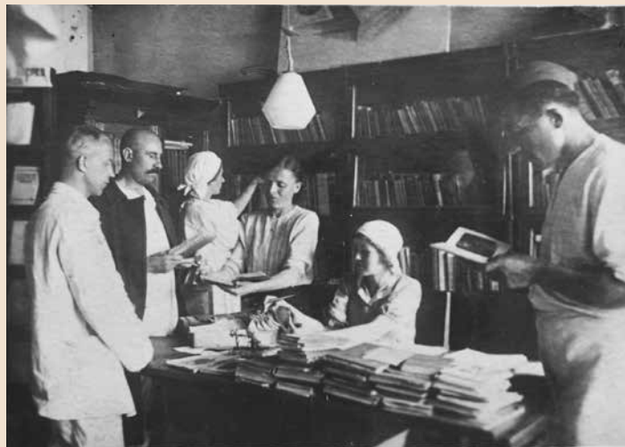
Выдача книг раненым больным в госпитале Distribution of books to wounded patients in the hospital