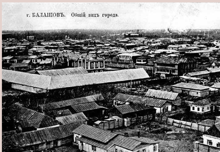
г. БАЛАШОВЪ. Общий видъ города.