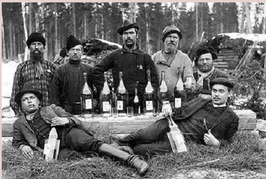
Артель новопокровских самогонщиков