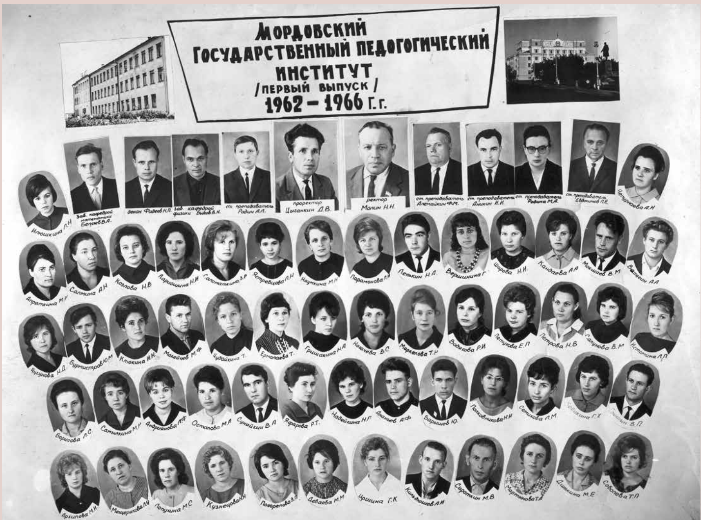
Первый выпуск Мордовского государственного педагогического института

16 ноября на втором заседании института Совет утвердил его Устав 31 . 10 декабря 1962 г. в Мордовском музыкально-драматическом театре состоялось торжественное собрание, посвященное организации в столице Мордовии МГПИ. В нем приняли участие студенты и преподаватели пединститута, руководство республики, представители областных организаций и общественности г. Саранска 32 . Результаты работы коллектива института, итоги первого семестра были отражены в докладе ректора МГПИ 33 .