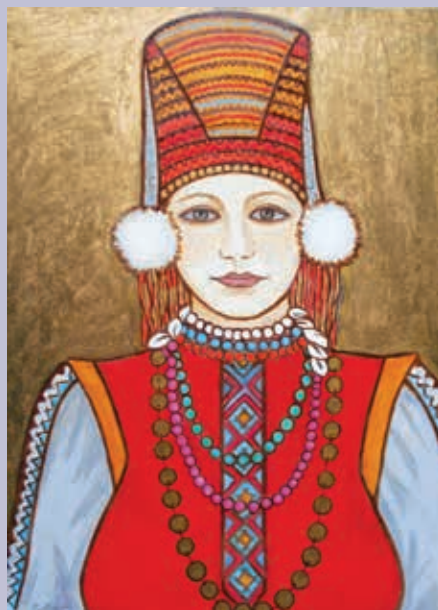
В. Ф. Козлова. Эрзянка. 2007. Бумага, монотипия, масляная пастель

лирического дарования, прозрачной акварели в цветочных натюрмортах, проникновенных пейзажах, посвященных волжским просторам, природе Мордовии, красоте старого и нового Саранска. Портреты, созданные ее рукой, всегда по-женски искренни и задушевные. Она умеет заглянуть в потаенные глубины души портретируемого. В декоративно решенных монотипиях «Мокшанка», «Эрзянка» (2007) даются чистые непосредственные образы молодых женщин с открытым взглядом на мир, что является типичной чертой национального характера.