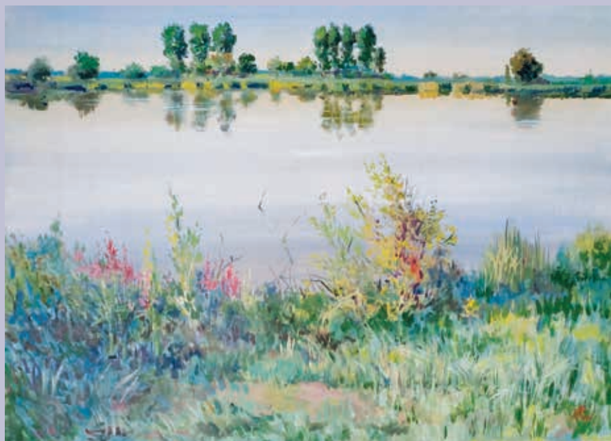
В. М. Шанин. Пруд в Судосево. 2021. Холст, масло

образы, изящно отточенные, как граненая мысль самого автора. Он видит в простых и привычных моментах жизни изначальную библейскую глубину. Таковы его лиричные пейзажи, выполненные в акварели, гуаши и живописи. В работах «Зимняя ночь» (2007), «Пруд в Судосево» (2021) художник размышляет о потаенном счастье земного рая.