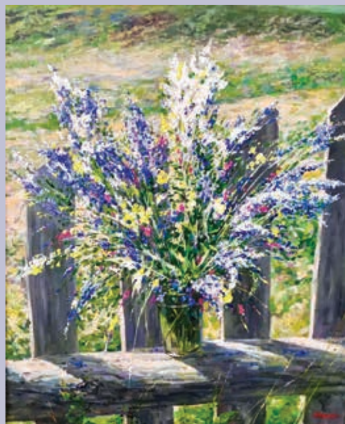
К. А. Попков. Сельский букет. 2019. Холст, масло