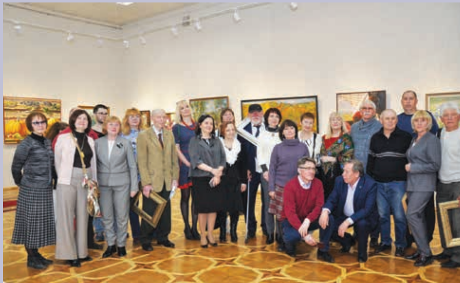
На открытии выставки в Саранске