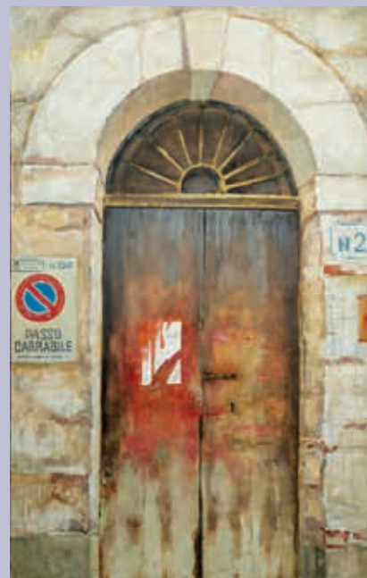
С. Ф. Коротков. Дверь № 2. 2019. Холст, масло

Образы представителей российской и мордовской культуры и науки, люди творчества являются центральными в искусстве худож-