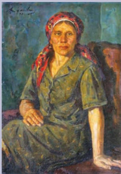
В. Д. Илюхин. Портрет колхозницы. 1973. Холст, картон, масло

Произведения художников-реалистов Мордовии всегда отлича-