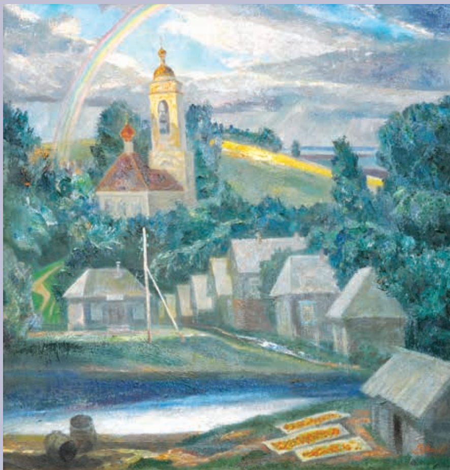
В. А. Попков. Возрождение. Дьяково. 1998. Холст, масло

ских ценностей, он первый из художников Мордовии высоко поднял знамя духовности в творчестве, обращаясь к теме Души. Ее