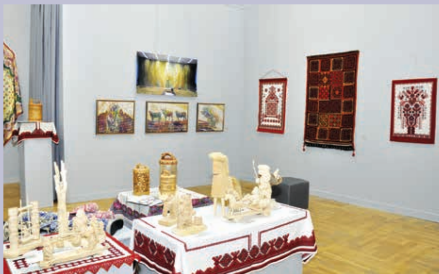
Выставка в Москве. Зал декоративно-прикладного искусства