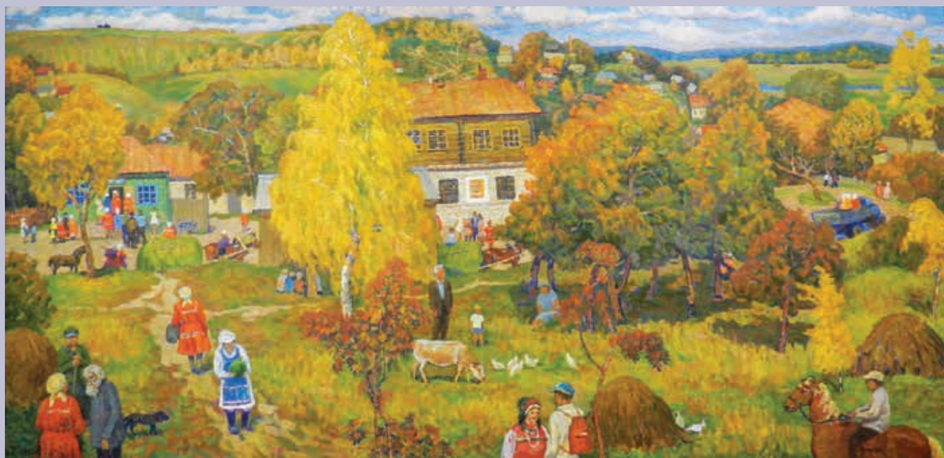
В. И. Петряшов. Осень в мордовском селе. 2022. Холст, масло

Единением национального мироощущения с особым философским,