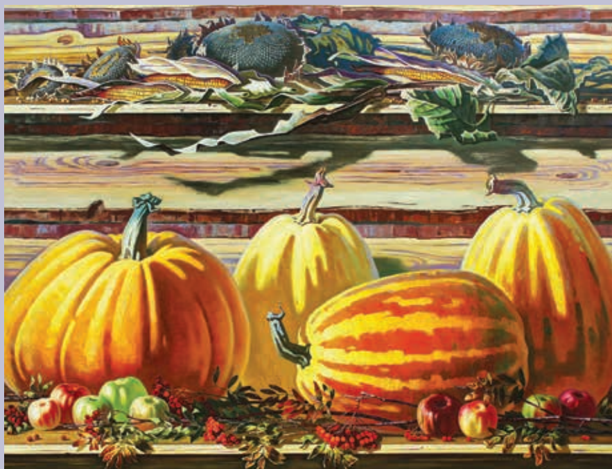
А. И. Кияйкин. Дары осени. 2017 — 2018. Холст, масло

Философской глубиной размышлений о драматических вехах российской истории, темой памяти и ее связи с современностью пронизаны холсты триптиха А. И. Кияйкина «Христианские святыни» (2017). Они заставляют задуматься о трагическом исчезновении истинной веры, об этом свидетельствуют зияющие пустоты оставшихся окладов икон, и в то же время об обретении надежды на ее возрождение — твердо стоящие оклады не должны быть пустыми. В триптихе особо акцентируется ассоциативно-символический подтекст. Завораживает прямой связью с современностью и его триптих «Воспоминания о Болгарии» (2000). Богатство, благородство и царственность цветовых сочетаний бирюзы, золота, терракоты, монументальность строгой выстроенности пейзажей раскрывают образ древней болгарской культуры, красоту старинных городов дружественной нам страны. Сейчас работы приобретают горьковатый привкус ностальгии по утерянному прошлому. Монументальный натюрморт А. И. Кияйкина «Дары осени» (2018) по эмоциональной насыщенности, ассоциативной содержательности больше близок к тематической картине.