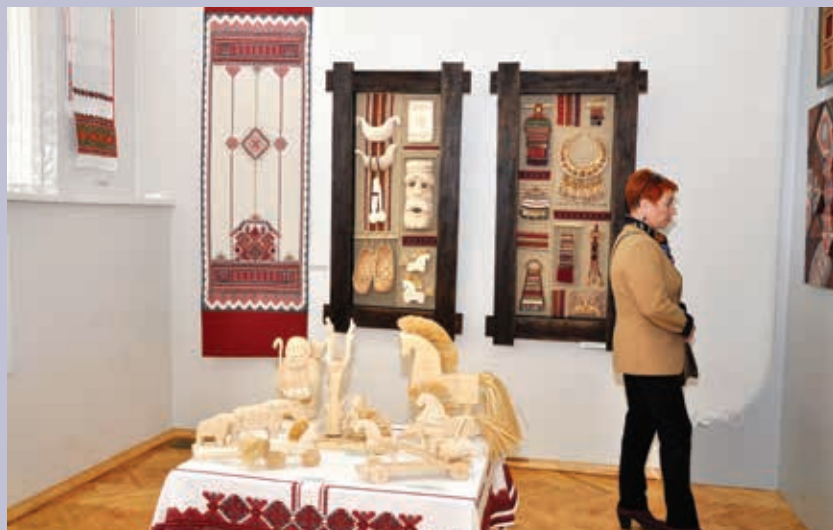
Экспозиции выставки в Саранске