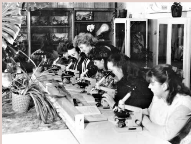
Занятия в лаборатории ботаники