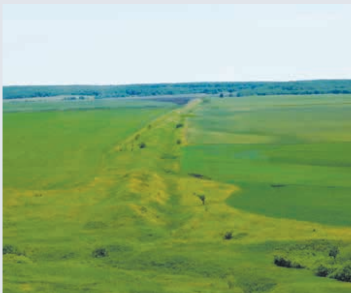
Вал засечной черты в районе с. Атемар Лямбирского района. Фото 2022 г.

The rampart of the abatis line in the area of the village of Atemar of the Lyambirsky District. Photo 2022