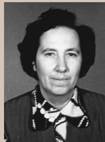
E. A. Oleinikova E. A. Oleinikova

человека» (в 1990 г. переведен на английский язык и популярен в англоязычных странах). Член ряда зарубежных академий наук. Включен в список «1000 научных лидеров мира» (Биографический институт Академии наук США), в справочники «1000 научных лидеров XX века» и «Великие мужчины и женщины науки» (Кембриджский университет). В 2002 г. вошел в число 500 видных отечественных исследователей в книгу «Известные русские». Награжден медалями почета и свободы (США) 8 .