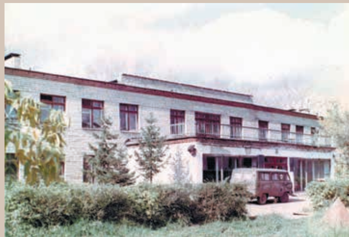
Корпус медицинского факультета на территории Мордовской республиканской клинической больницы The building of the Medical Faculty on the territory of the Moravian Republican Clinical Hospital

В 1947 г. поступил в Ташкентский медицинский институт, окончил 4 курса, затем перевелся в 3-й Московский медицинский институт. Полный курс меди-