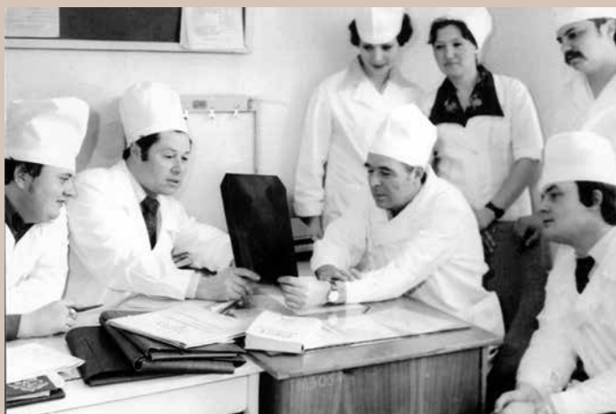
Обсуждение тактики лечения больного сотрудниками курса травматологии совместно с врачами отделения. 1970 г.