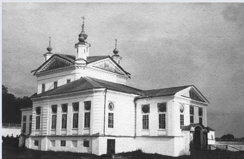
Собор Спасо-Преображенского монастыря. Начало XX в.