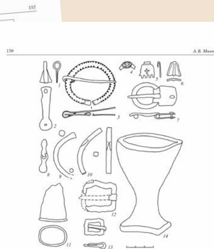
Рис. 2. Вещевой инвентарь марийских городищ

Ардиновское городище расположено в 300 м от восточного берега р. Селкиново. Климатический район Республики Марий Эл в месте правого берега р. Арды на мысу полуостровной формы высотой от уровня реки 17,7 м. Общая исследованная площадь составляет 330,0 кв. м.