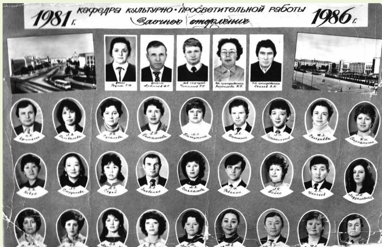
Выпуск Восточно-Сибирского государственного института культуры. 1986 г. Graduates of the East Siberian State Institute of Culture. 1986.