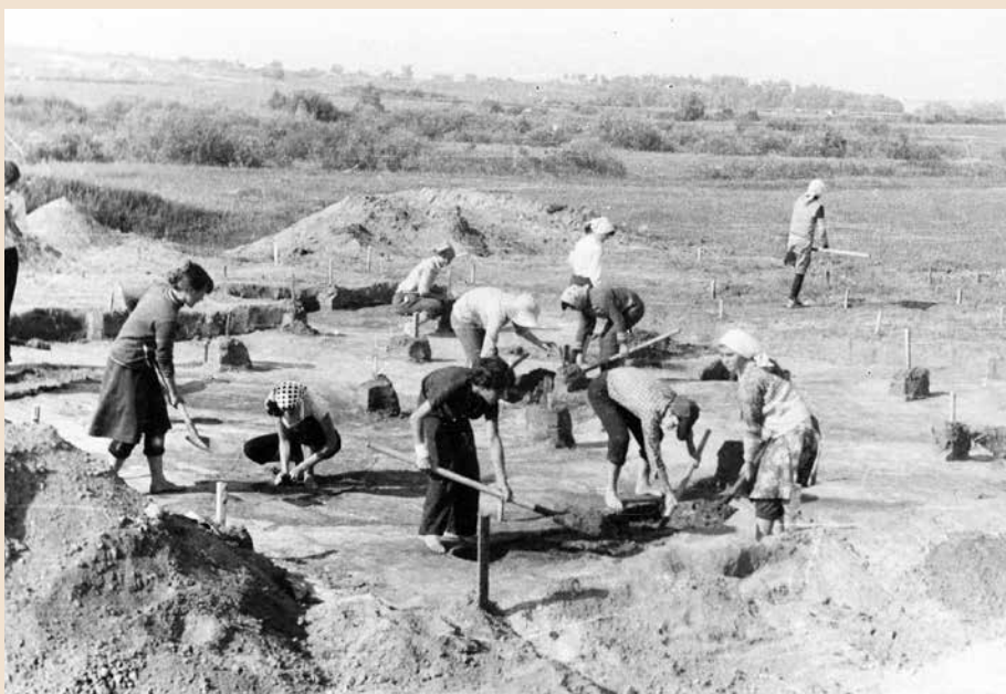
Во время раскопок Шокшинского могильника. 1984 г. НА НИИГН During the excavations of the Shokshinsky burial ground. 1984. Scientific Archive of the Research Institute of the Humanities by the Government of the Republic of Mordovia

Книга «Шокшинский могильник...» представляет значительный интерес для изучения этнической истории и культуры народов Волго-Окского междуречья и Среднего Поволжья и может быть использована не только специалистами-археологами (при подготовке научных обобщений), но и историками (при разработке курсов лекций для вузов) и музейными работниками (при организации музейных выставок и экспозиций).