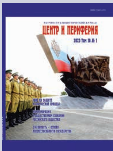
Обложки журналов «Центр и периферия» Covers of the Journal «Center and Periphery»