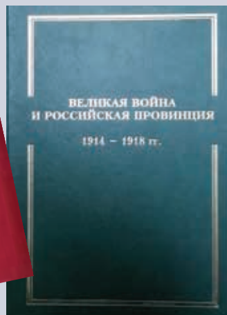
Обложки книг «Начертание мордовской истории», «Великая война и российская провинция. 1914 — 1918 гг.» The covers of the books “The Outline of the Mordovian history”, “The Great War and the Russian Province. 1914 — 1918”