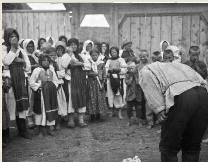
Молебен перед отъездом солдат в армию (фото слева). Солдат прощается с домом и семьей (фото справа). 1914 г. с. Вечканово Бугурусланского уезда Самарской губернии. Фото А. О. Вяйсянена

Prayer service before the soldiers leave for the army (photo on the left). A soldier says goodbye to his home and family (photo on the right). 1914 Village of Vechkanovo, Buguruslansk district, Samara province. Photo by A. O. Vyasyanin (URL: https://vk.com/wall-176558385_2578 )