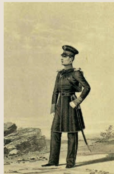
Воин и обер-офицер пеших полков Симбирского ополчения. 1812 — 1813 гг.

(Висковатов А. В. Историческое описание одежды и вооружения российских войск: в 30 т. СПб., 1841 — 1862. Т. 18. № 2550, 2551)